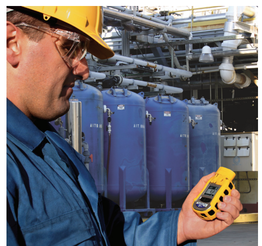
Überwachung der Belastung der Arbeiter mit ToxiRAE Pro PID in einem PVC-Werk