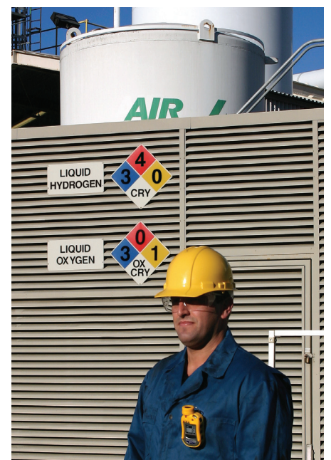
Zuverlässiges Personenschutzgerät in praktischer Abmessung